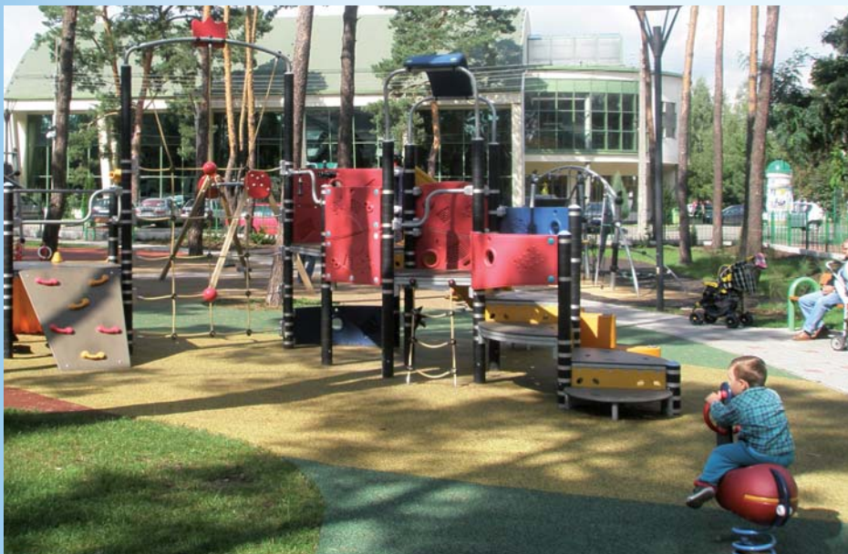
Pierwszy nowoczesny plac zabaw przy ul. Długiej

W pierwszych dniach lutego 2008 roku oddano do użytku plac zabaw przy ulicy Długiej naprzeciw Integracyjnego Centrum Sportu i Rekreacji. Pierwszy wykonany w większości ze stali i plastiku. Wówczas wyglądał wręcz kosmicznie. Wśród urządzeń do zabawy są m.in. zjeżdżalnia, kabina ciężarówki, piaskownica, a nawet ścianka wspinaczkowa – na bezpiecznym, miękkim podłożu. Kosztował prawie jeden milion zł.