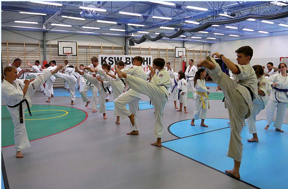
Sale gimnastyczne w hali sportowej przy Szkole Podstawowej nr 2, w sąsiedztwie budynku szkolnego przy ul. Sienkiewicza tętnią życiem