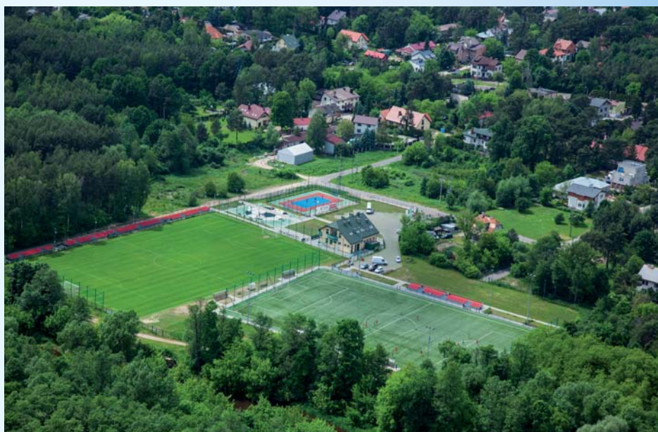
Największa sportowa inwestycja w roku 2012 to tereny sportowo-rekreacyjne nad Świdrem