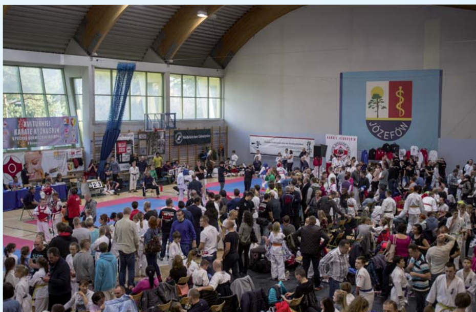
W hali widowiskowo-sportowej odbywają się nie tylko szkolne zajęcia WF, ale bardzo często duże imprezy sportowe i kulturalne

2002), a młodzież rozpoczęła naukę już od 1. września 2001 roku w perfekcyjnie wyposażonym gimnazjum. Ta imponująca inwestycja została wyróżniona tytułem „Budowy Roku 2003”.