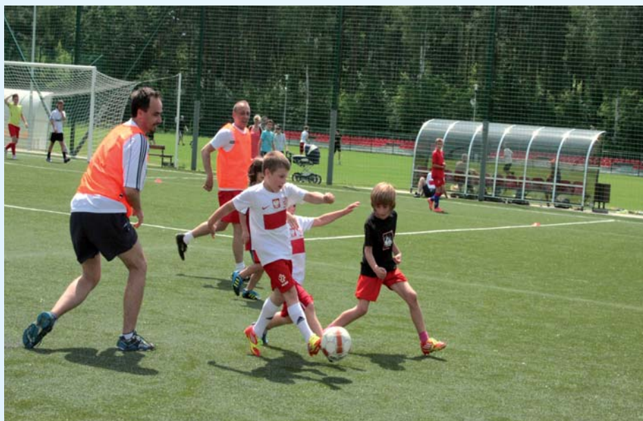
Pokaz piłkarskich umiejętności podczas uroczystego otwarcia terenów sportowo-rekreacyjnych nad Świdrem

Dziś na boiskach MLKS Józefovia trenuje około 330 dzieci, z których blisko 260 mieszka w Józefowie. – Trenują już przedszkolaki. Gdybyśmy ogłosili kolejny nabór, z miejsca mielibyśmy jeszcze stu chętnych – mówi