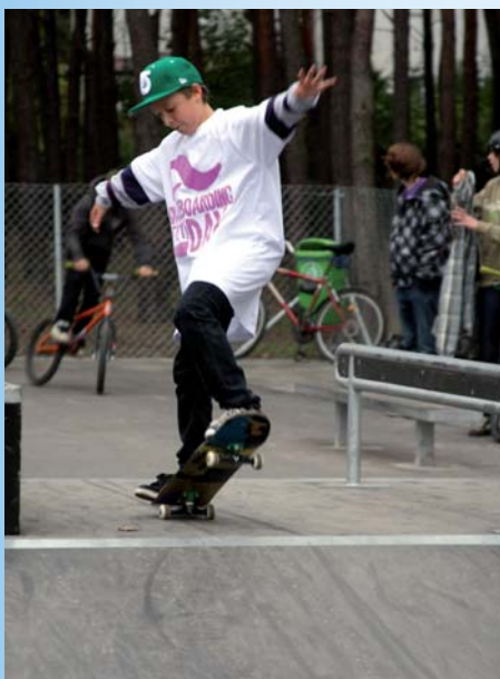
Skate park na przeciwko boiska SP nr 2

Skate park przy ulicy Wawerskiej ma wymiary 12 x 40 metrów i zajmuje powierzchnię równą 480 metrom kwadratowym. Jest oświetlony, profesjonalny i przeznaczony dla rowerzystów, deskorolkarzy oraz rolkarzy, a nad bezpieczeństwem korzystających z niego czuwa oko kamery. Jest na nim bezpiecznie i czysto, szybko zyskał popularność wśród młodzieży.