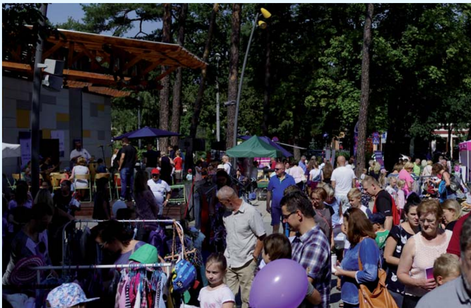
Na skwerze im. św. Jana Pawła II odbywają się zarówno imprezy oficjalne jak i radosne pikniki