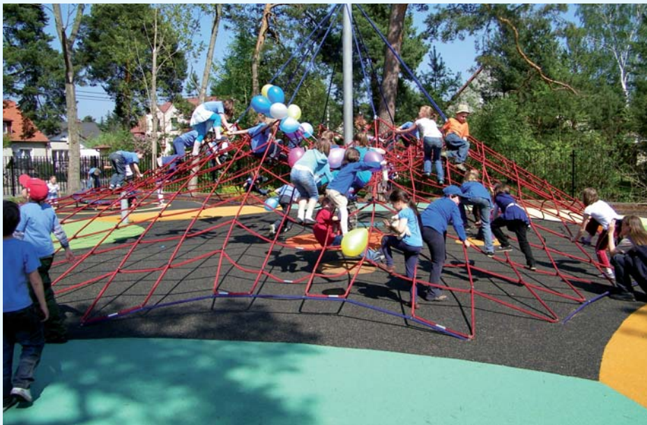
Plac zabaw przy ul. Małej, w sąsiedztwie Szkoły Podstawowej nr 2

swoją siedzibę w obecnym budynku Rady Miasta, a jeszcze wcześniej przy ulicy Piotra Skargi.