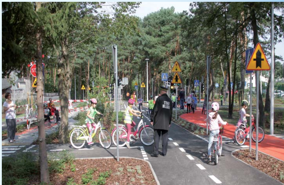
Miasteczko Ruchu Drogowego – tu dzieci w praktyce uczą się właściwego zachowania na drodze