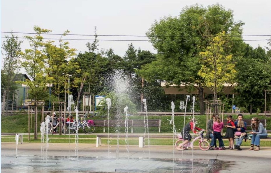
Fontanna na skwerze im. św JP II jest ulubionym celem leptnich spacerów

wą ścieżkę rowerową zakończoną placem treningowym, chodniki dla pieszych. Zainstalowana jest sygnalizacja świetlna, znaki drogowe, barierki zabezpieczające, słupki blokujące. Ponadto na jezdni i chodnikach jest oznakowanie poziome. Całość terenu jest ogrodzona i oświetlona, znajdują się tu także stojaki rowerowe, ławki a nawet plac z huśtawką.