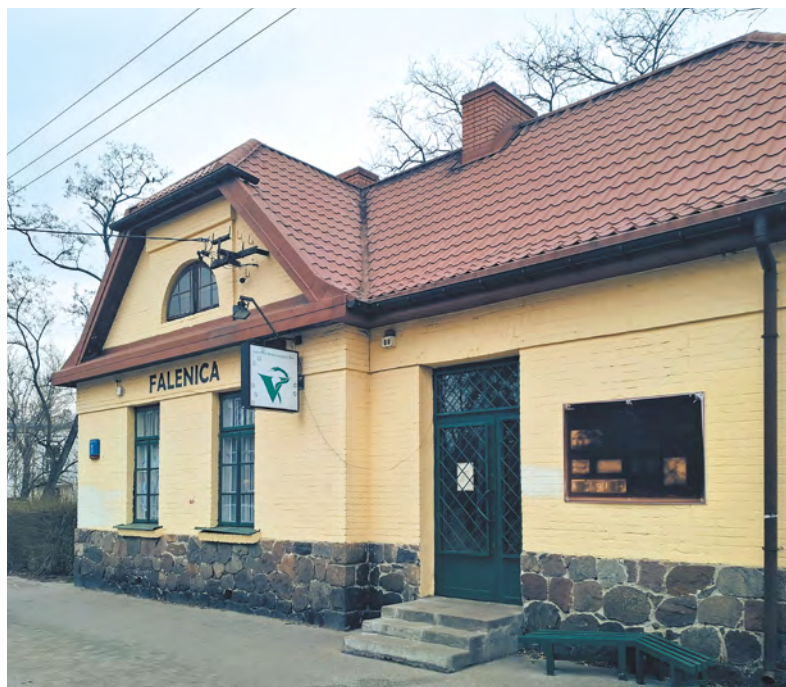
Dawna stacja kolejki wąskotorowej wiodącej z Jabłony do Karczewa.