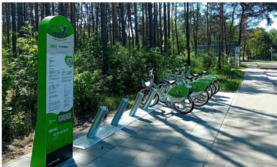
Stacja u zbiegu ulic Wyszyńskiego i Nadwiślańskiej.

Na lutowej sesji Rada Miasta podjęła uchwałę, na mocy której trzy miasta: Józefów, Warszawa, Otwock oraz firmy Nextbike Polska S.A. i Nextbike GZM (operatorzy systemu rowerów miejskich) mogły zawrzeć porozumienie pozwalające na wypożyczenie i zwrócenie roweru na dowolnej stacji należącej do systemu w jednym z tych miast. To szczególnie wygodne, gdy chcemy przejechać np. z Warszawy czy Otwocka do Józefowa. – VeloYou to odpowiedź na prośby mieszkańców, które napływały do miasta od dłuższego czasu. Z chwilą gdy system rowerów miejskich dotarł do pobliskiego Wawra uruchomienie go w Józefowie stało się tym bardziej uzasadnione. – Z pewnością jest to duże wsparcie dla józefowian, zwłaszcza wobec planowanej niebawem modernizacji linii kolejowej i spodziewanych w związku z tym utrudnień drogowych. Do tego dochodzą oczywiste argumenty eko-