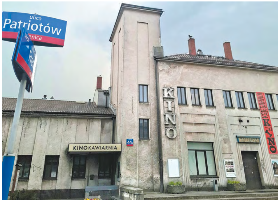
Dawny budynek dworca Kolei Nadwiślańskiej.