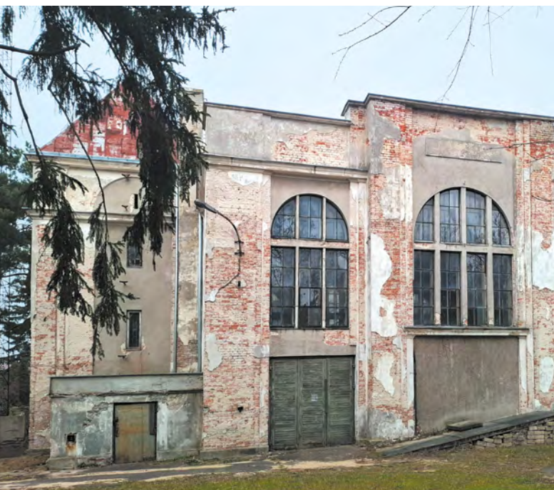
Przedwojenny budynek dawnej elektrowni gminnej.

Idziemy dalej ulicą Frenkla, skręcamy w lewo w Bambusową, gdzie