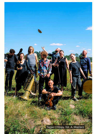
Tęgie Chłopy

Miejski Ośrodek Kultury w Józefowie ul. Kard. Wyszyńskiego 1 05-420 Józefów