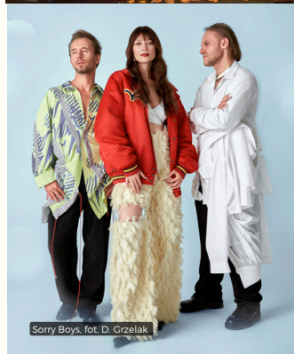
Sorry Boys