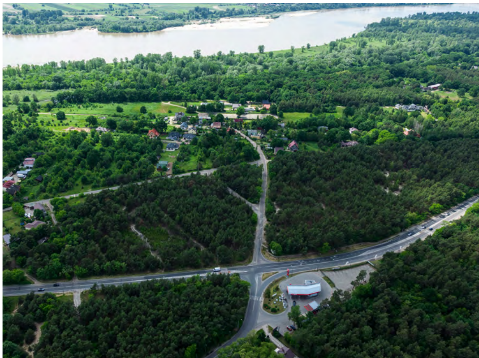
Górkach – najdalej na południe wysunięta część Józefowa.

W spotkaniu wzięli udział także licznie przybyli mieszkańcy, szczególnie z Górek, którzy przedstawili radnym sejmiku problemy, z którymi na co dzień borykają się od lat. Brak chodnika i ścieżki rowerowej mię-