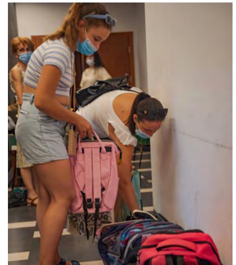
Plecaki dla uczniów