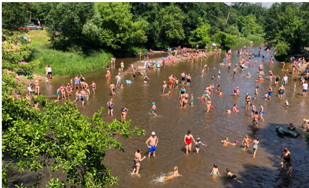
Świder tego lata jak zwykle okazał się lekarstwem na upały