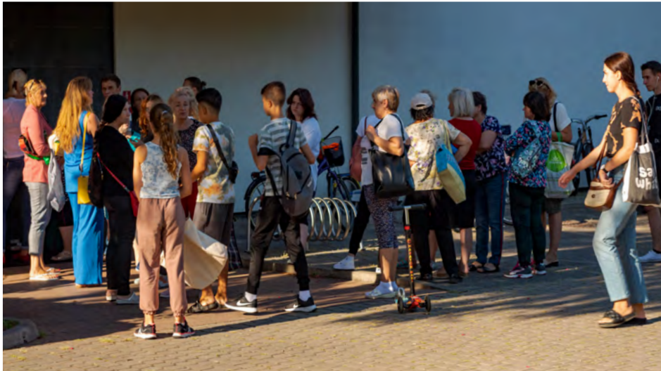
W oczekiwaniu na otwarcie punktu pomocy rzeczowej