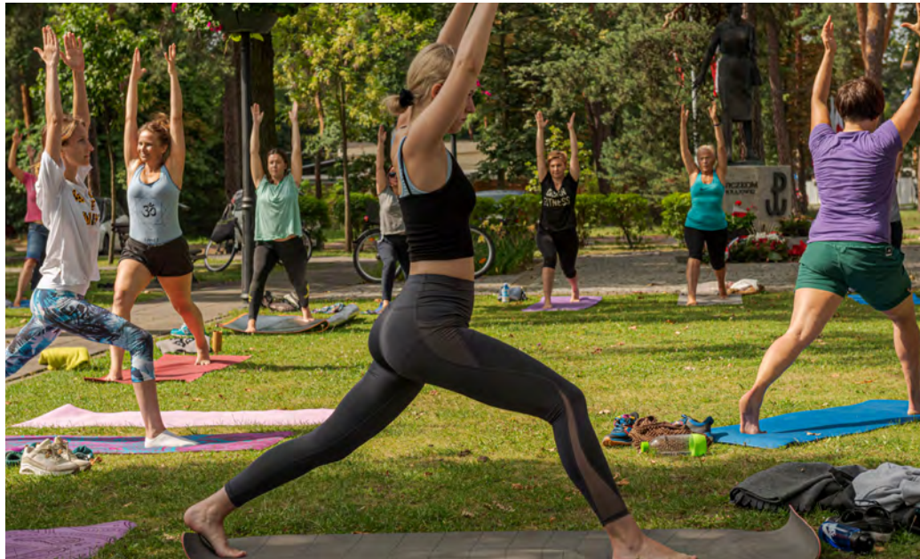
Zakończyła się kolejna edycja Jogi w parku