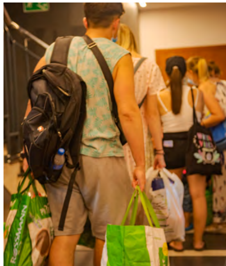
Cotygodniowe zaopatrzenie dla całej rodziny