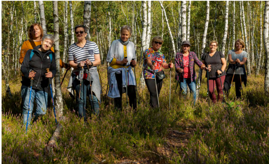
Nordic Walking – sezon trwa cały rok