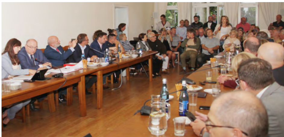
Na spotkanie komisji licznie przybyli mieszkańcy Józefowa, a szczególnie Górek.