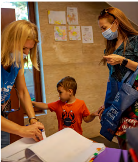
Rejestracja w księdze prowadzonej przez wolontariuszy