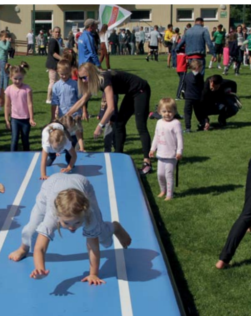
Pokazowe zajęcia z gimnastyki