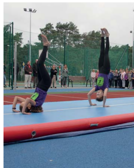
(Miasto Józefów) Fot. Wojciech Siergiejuk

Dzięki inwestycjom w kulturę i sport, realizowanym konsekwentnie przez wiele lat, dzisiejsza oferta rekreacyjna Józefowa jest szczególnie bogata i gromadzi nie tylko mieszkańców samego miasta, ale również okolicznych rejonów. Kilka hal sportowych, basen o wymiarach olimpijskich z widownią, czy profesjonalne tereny piłkarskie są zachętą dla licznych klubów i drużyn sportowych do organizowania zajęć i propagowania aktywności fizycznej. Młodszy mają do dyspozycji kilka boisk wielofunkcyjnych, skate park, miasteczko ruchu drogowego i kilkanaście placów zabaw.