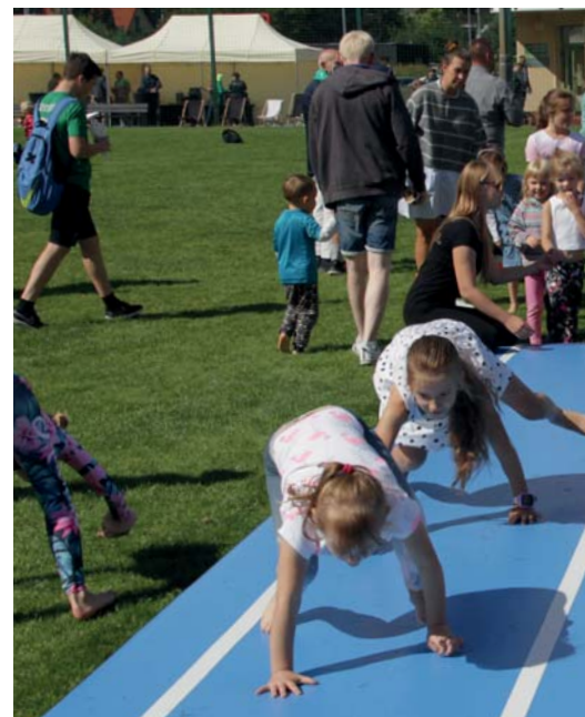
Drużyny: Gwiazd i Józefovii