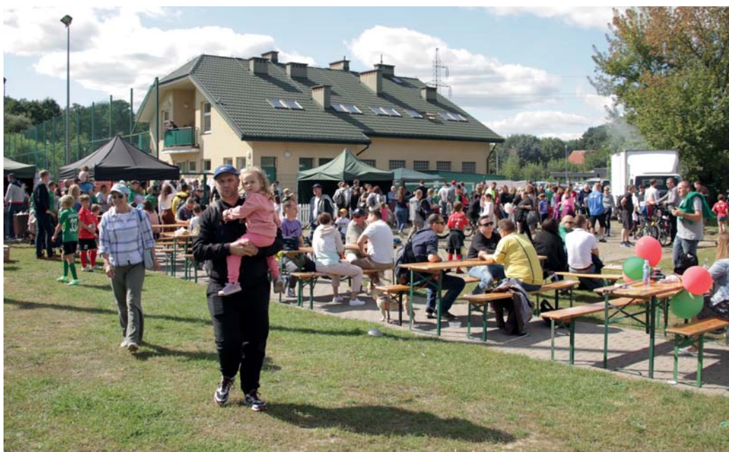
Powodzenie miało smaczne zaplecze gastronomiczne