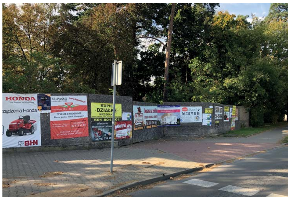
Rondo im. Jerzego Popiełuszki w Michalinie – czeka na uporządkowanie.