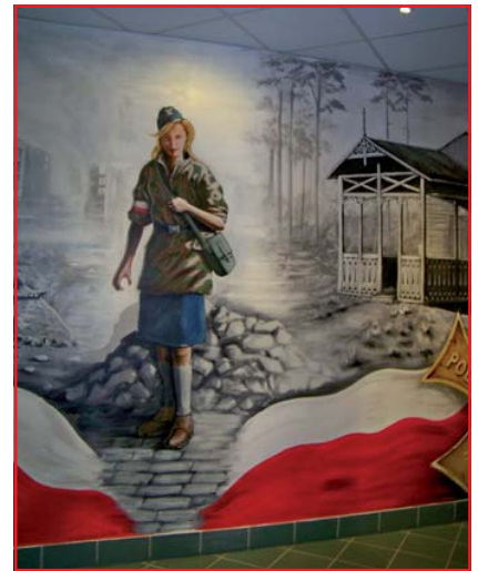
Mural w holu szkoły

Program artystyczny uświetnił koncert chóru Zespołu Reprezentacyjnego Wojska Polskiego, ale najgorętsze brawa