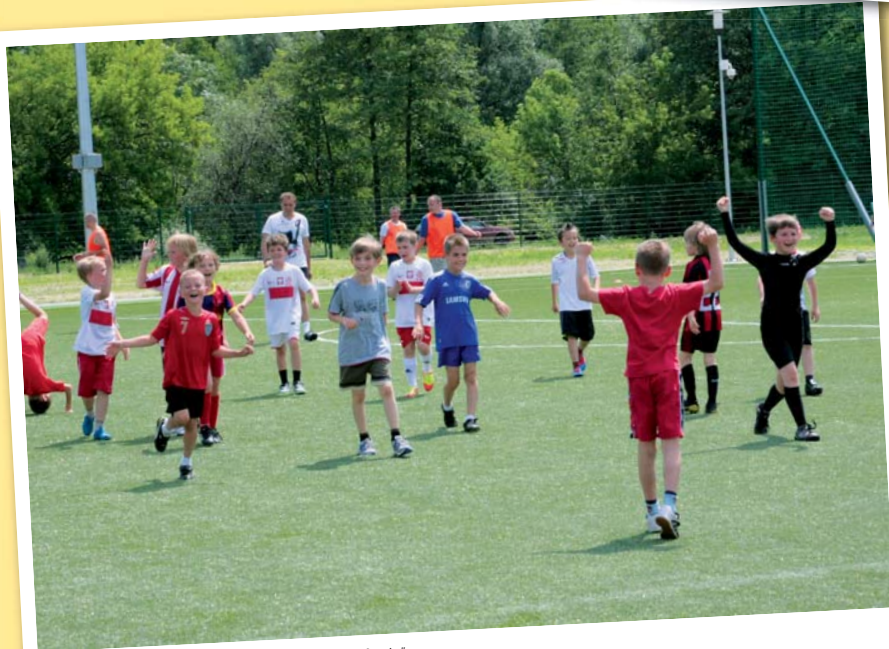
Latem odbędą się rozgrywki o „Puchar lata w Józefowie”