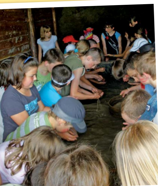
Zajęcia w świetlicy środowiskowej

Tegoroczne lato w świetlicach środowiskowych prowadzonych przez stowarzyszenie Forum Chrześcijańskie przy parafiach: Matki