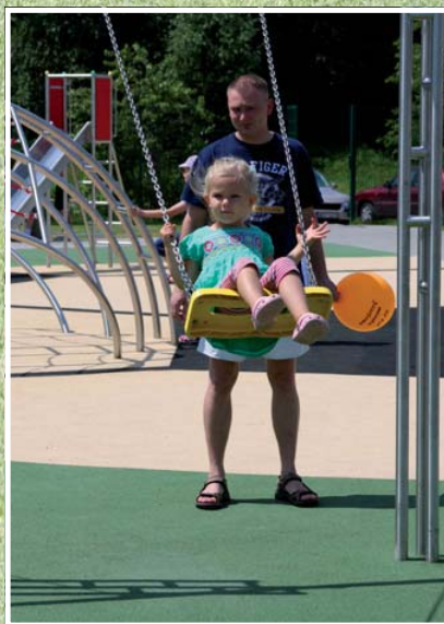
Plac zabaw z licznymi atrakcjami dla dzieci w różnym wieku