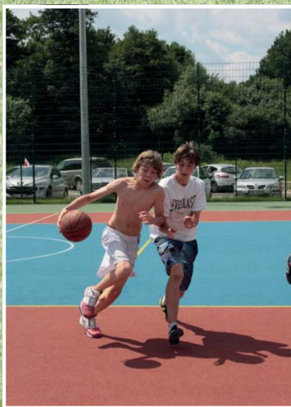
Boisko do koszykówki