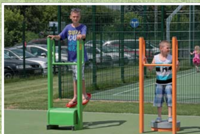
Urządzenia do ćwiczeń