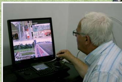
Nadzór monitoringu – jest bezpiecznie!