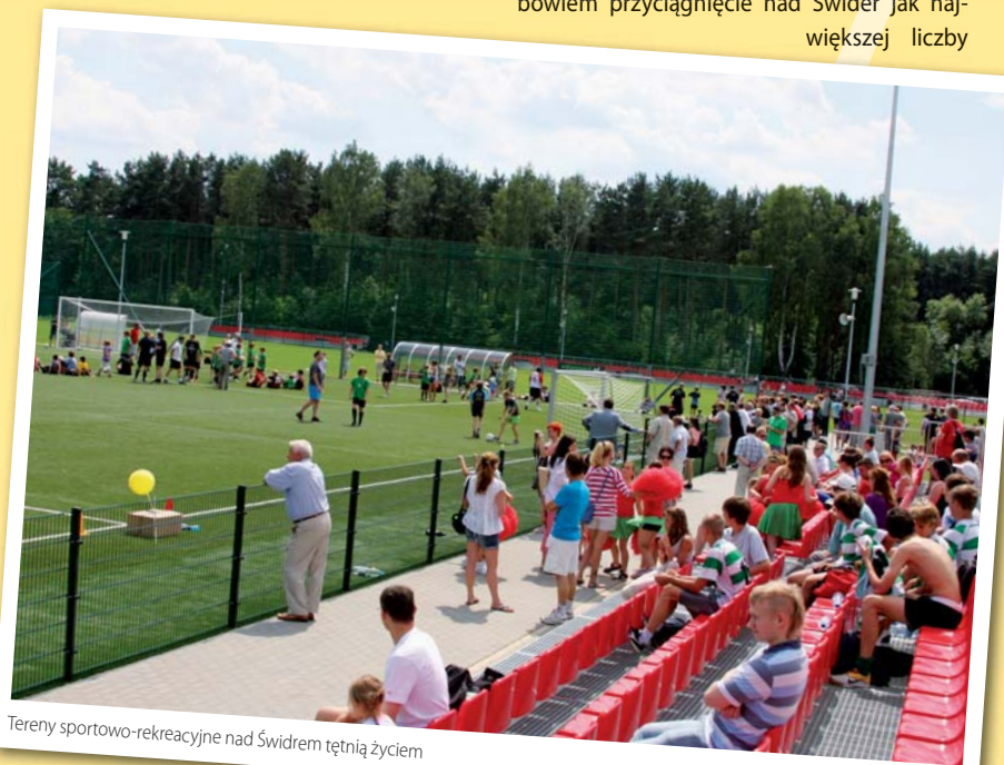
Tereny sportowo-rekreacyjne nad Świdrem tętnią życiem

Dokładne informacje dotyczące akcji „Lato w mieście”, planów treningowych oraz działalności klubu można uzyskać w siedzibie Józefovii przy ulicy Dolnej 19, a także znaleźć na stronie internetowej www.jozefovia.futbolowo.pl i na profilach serwisów społecznościowych Twitter i Facebook.