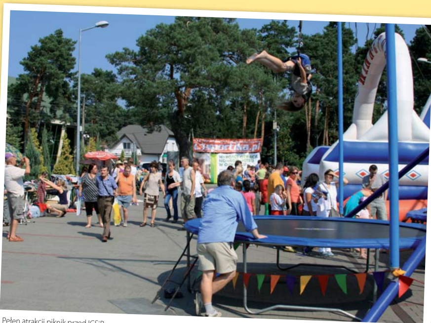
Pełen atrakcji piknik przed ICSiR

Szczegóły dotyczące akcji „Lato w mieście” oraz imprez organizowanych podczas wakacji przez Integracyjne Centrum Sportu i Rekreacji będzie można znaleźć na stronie internetowej www.icsir.pl oraz na facebook’owym profilu ośrodka.