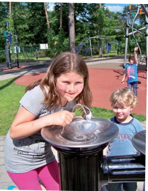
Zdźrój na placu zabaw przy ulicy Długiej cieszy się powodzeniem

Podobnie jak w poprzednich latach, Referat Oświaty Urzędu Miasta jest organizatorem półkolonii. Przez cały lipiec od poniedziałku do piątku w godzinach od 8.00 do 16.00 na