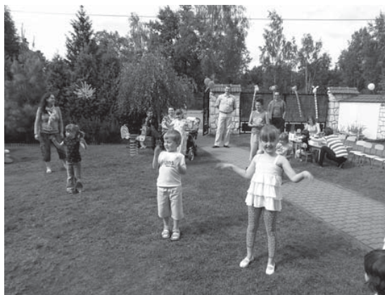
Otwarty ogród w przedszkolu Józefinka

Maluchy z przedszkola „Józefinka” przy ulicy Skłodowskiej wzięły udział w dwóch grach tematycznych, przeplatanych dla urozmaicenia tanecznymi zabawami ruchowymi. Z kartonowych pudeł wybudowały duży tort urodzinowy dla miasta, a potem odbyło się adoptowanie choin. Dzieci wraz z rodzicami najpierw ozdobiły osłonki drzewek, potem wpisały się do pamiętnika (takiej wspólnej metryki 50 roślinek), a wreszcie zabrały sosenki do własnych ogrodów, aby je tam posadzić.