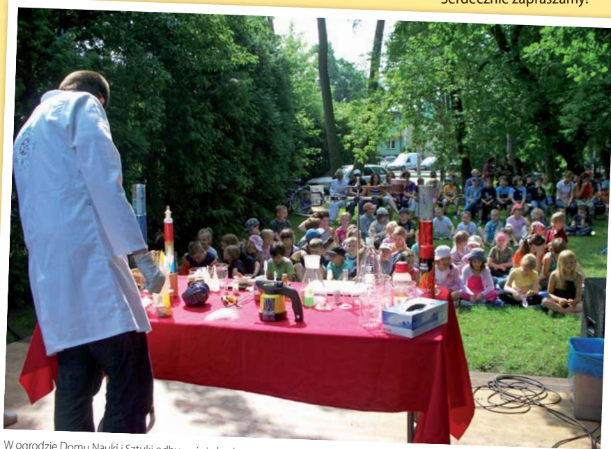
W ogrodzie Domu Nauki i Sztuki odbywać się będą zajęcia dziecięcej letniej akademii naukowej