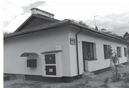
Po remoncie