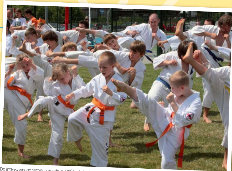
Do intensywnego sezonu zawodnicy UKS Bushi będą przygotowywać się poza Józefowem

Pierwsze ze zgrupowań – w nadmorskim Dźwirzynie – już się rozpoczęło (30 czerwca – 13 lipca), ale lista uczestników na drugi obóz, który odbędzie się w dniach 20–30 sierpnia w Górowie Iławeckim – wciąż nie została zamknięta. Zostało jeszcze kilka wolnych miejsc, ale zainteresowani powinni się spieszyć. Ci, którzy wybiorą się z klubem na północ województwa warmińsko-mazurskiego, z pewnością nie