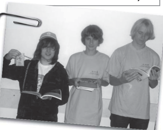
Reprezentowali gimnazjum – wrócili z medalem!