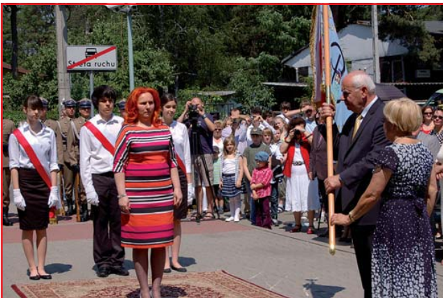
Przekazanie sztandaru i ślubowanie