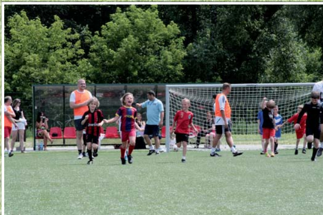
Najwyższej jakości boisko ze sztuczną nawierzchnią