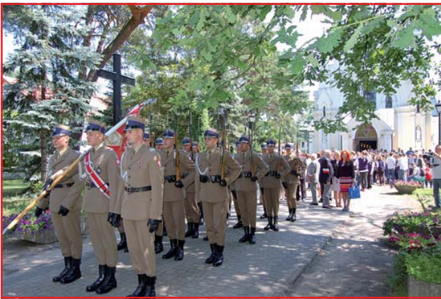
Po uroczystej mszy, przemarsz ulicami miasta do szkoły