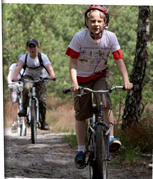
Czekają rowerowe szlaki