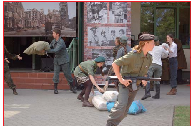
Inszenizacja: sceny z Powstania Warszawskiego