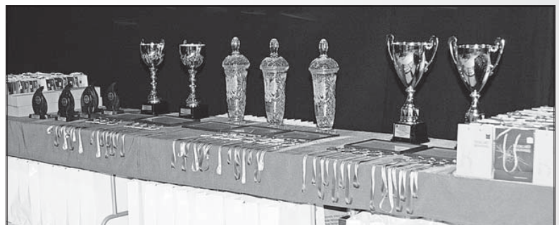
Listy gratulacyjne i puchary dla mistrzów, wśród nich kryształowe puchary od Prezydenta RP