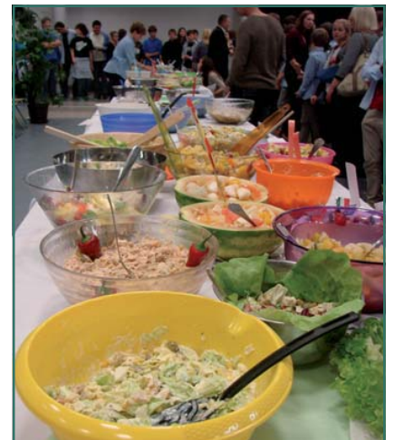
21 przepisów na sałatki – rozsądne odżywianie