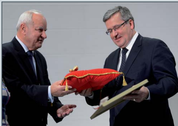
Symboliczny klucz do bram miasta