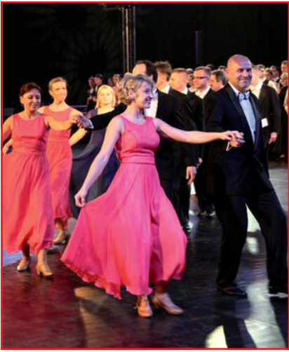
Poloneza czas zacząć