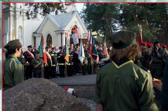
W kościele pw. Matki Boskiej Częstochowskiej