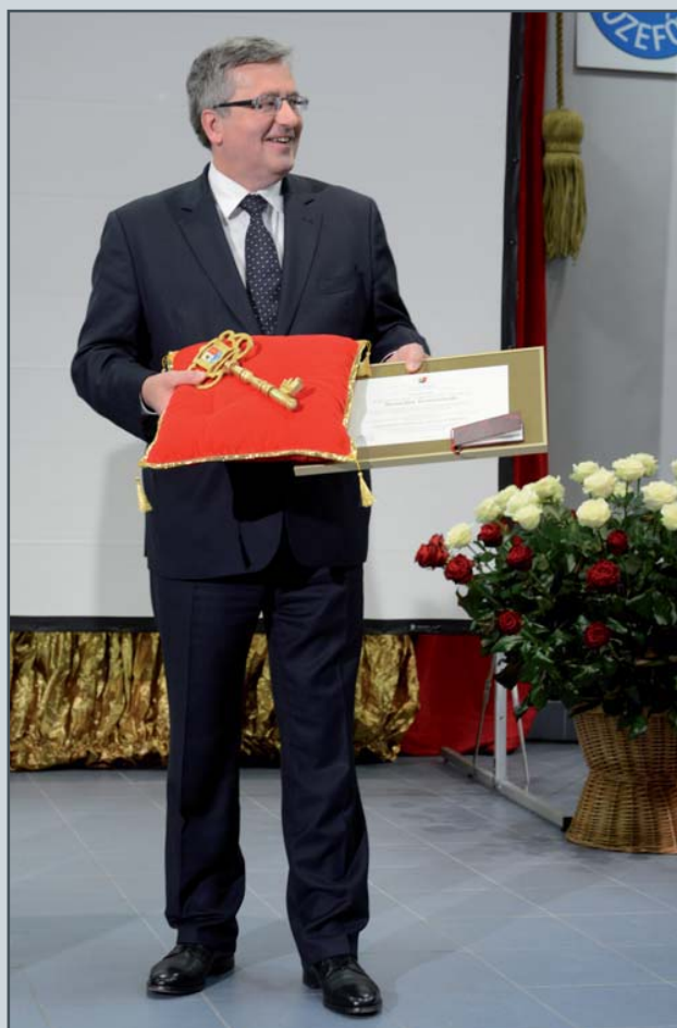
Honorowy Obywatel Józefowa Bronisław Komorowski