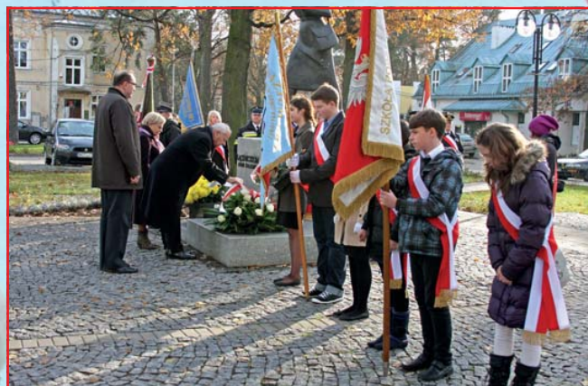
Złożono kwiaty pod pomnikiem Łączniczek AK