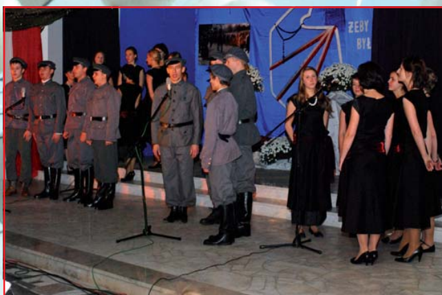
Wieczorna w kościele na Błotach z chórem Schola Cantorum Maximilianum