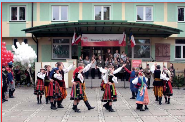
Inscenizacja przygotowana przez uczniów Gimnazjum im. Łączniczek AK uświetniła uroczystości odbywające się pod Urzędem Miasta