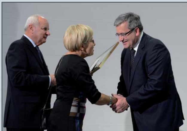
Przewodnicząca Rady Miasta wraz z burmistrzem wręczają prezydentowi dyplom Honorowego Obywatela Józefowa